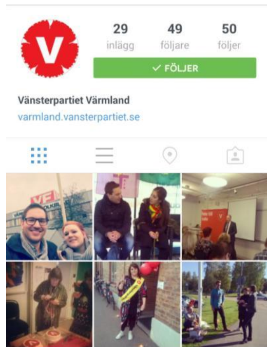
4 Vänsterpartiet Värmlands Instagram

Fördelen med Instagram är att det är enkelt med bilder, ta en bild och skriva ”nu har vi styrelsemöte och diskuterar verksamhetsplan för 2015”, det kan också ge liv till t.ex. en hemsida (se varmland.vansterpartiet.se ) om bilderna rullar där.