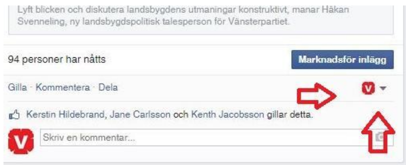
Figur 8 Skapa en facebookside, 4

Kom ihåg att allt du kommenterar som skrivits som din sida skriver du som sidan, för att skriva som dig själv behöver du aktivt gå in och ändra till dig själv. Det gör du här: