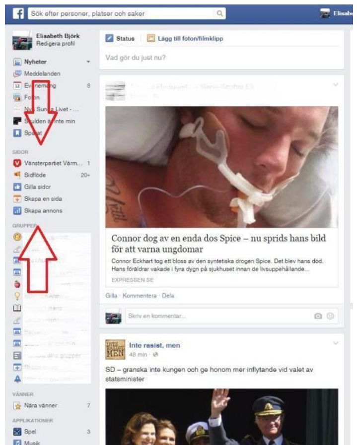
Figur 5 Skapa en facebook sida, 1

Ni får också fylla i kort information om er, t.ex. ”Vänsterpartiet Grums arbetar för ett mer rättvist och jämställt Grums. Vi är ett socialistiskt och feministiskt parti på ekologisk grund.”