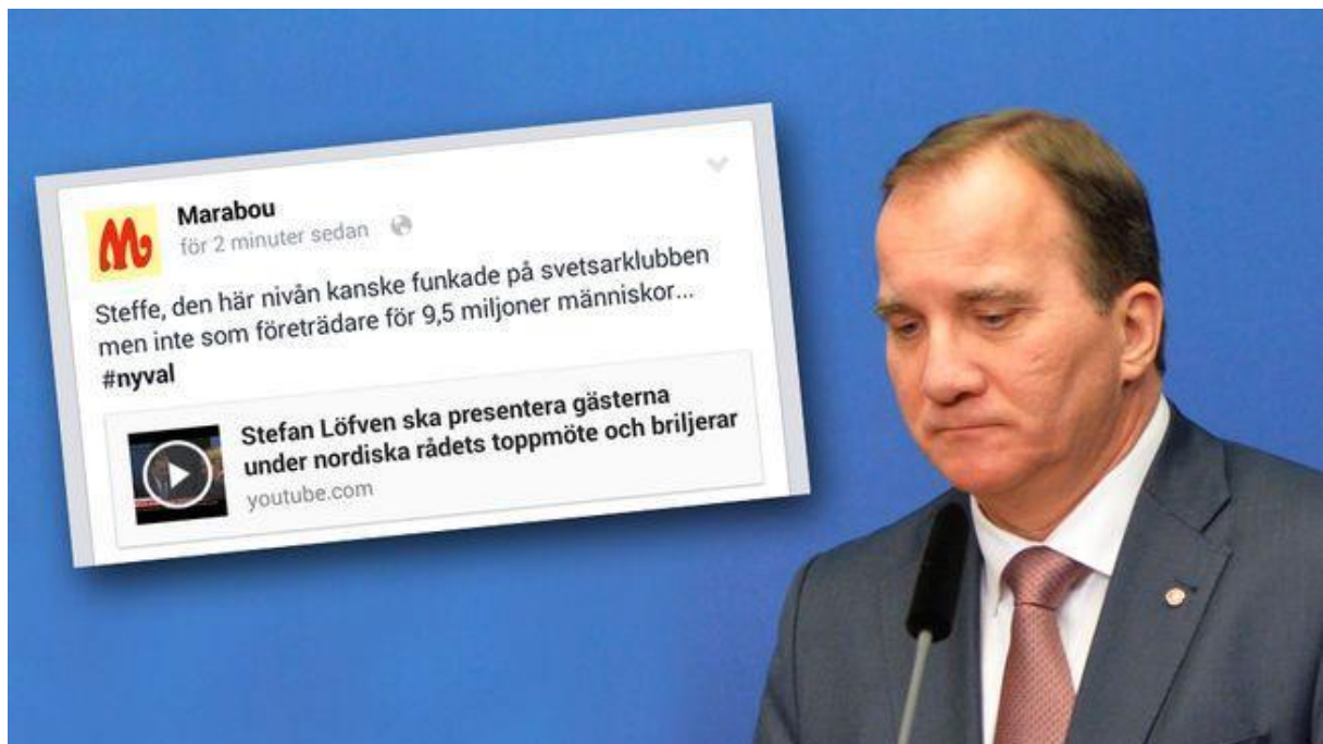
9 Exempel på när någon publicerat privat på offentlig sida. Källa .

Om det råkar bli fel, om något missuppfattas av det du skrivit eller om du råkat uttrycka dig klumpigt, ta bort det och be om ursäkt. Säg att det blev fel. Kontakta distriktet om du behöver hjälp.