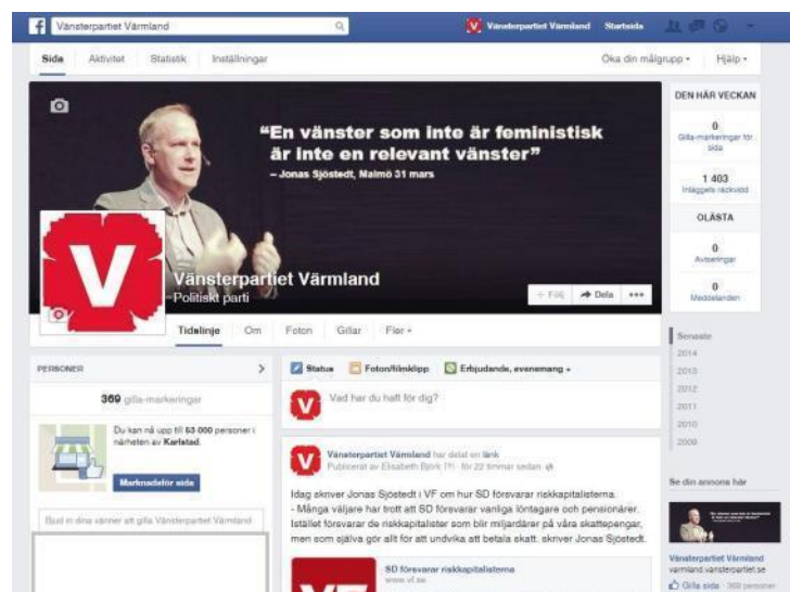
2 Vänsterpartiet Värmlands facebookside

Distriktet kan länka till facebooksidan via distriktets hemsida, på så sätt kan personer som letar information via distriktet hitta till facebooksidan. Har man en egen hemsida fungerar det också bra att länka via den. Man kan också i mail eller utskick tipsa medlemmar om att gilla sidan, ju fler som gillar desto större spridning kan inläggen få.