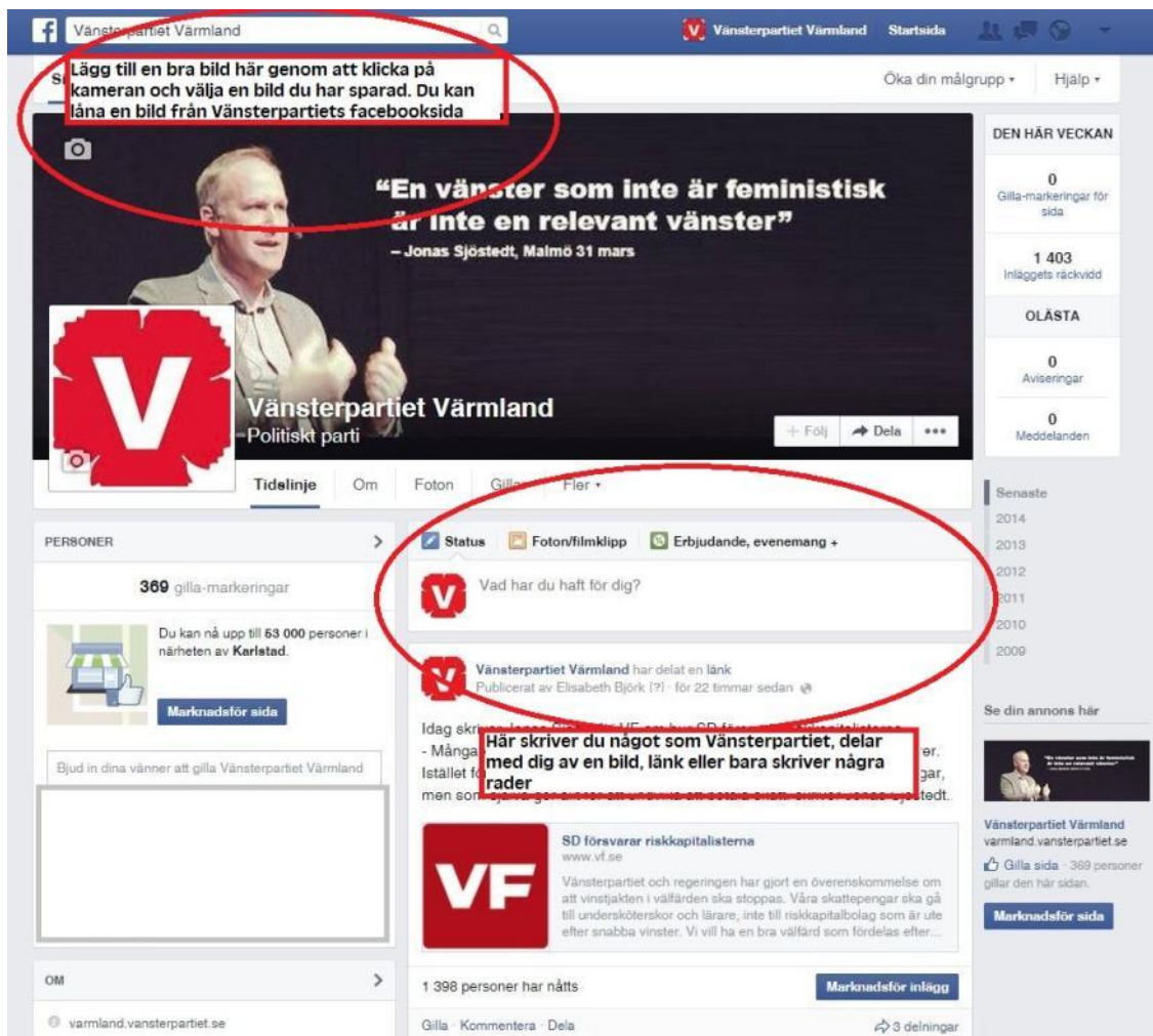
Figur 7 Skapa en facebookside, 3

Nu är ni klara att börja dela information på er sida! Det gör ni genom att gå in på sidan och skriva statusfältet.